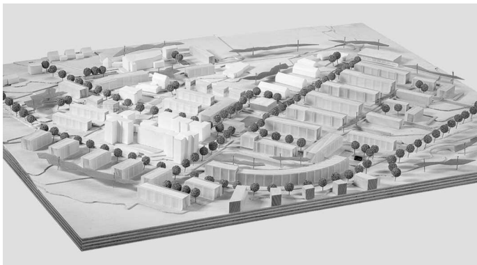
1. Preis: Hirner und Riehl, München · Adler & Olesch, Nürnberg