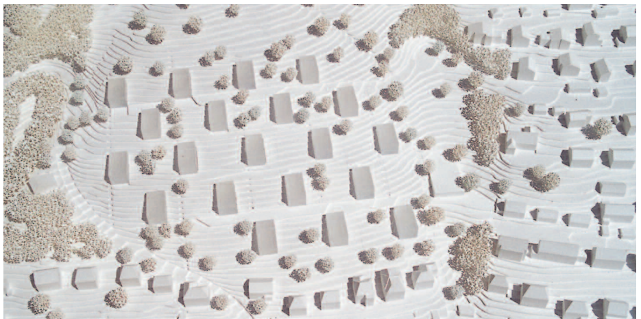
Ankauf: Heinle · Wischer und Partner, Stuttgart · Kienle Planungsges. Freiraum und Städtebau