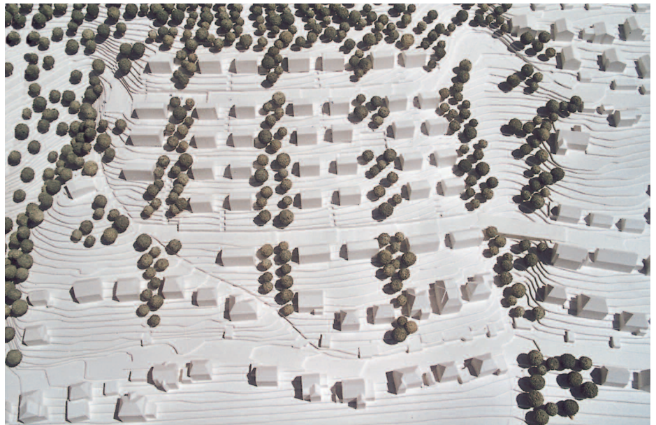
1. Preis: Meurer Architekten, Frankfurt · Bielefeld · Gillich + Heckel, Trier

L.Arch.: Kienle Planungsgesellschaft Freiraum und Städtebau GmbH