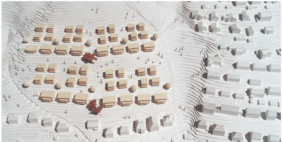
4. Preis: Architekturbüro Könekamp, Esslingen · Isabel Könekamp, Esslingen