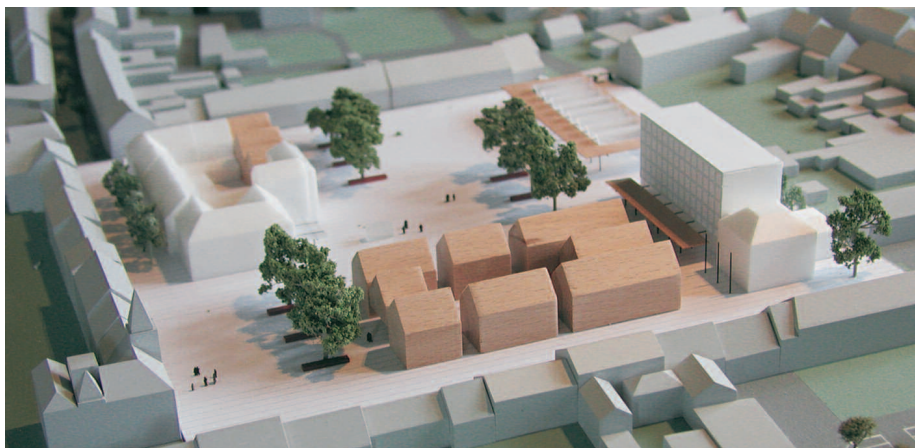
1. Preis: Ader · Kleemann, Kalkar · Wbp Landschaftsarchitekten, Bochum