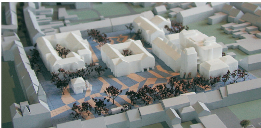
3. Preis: Planungsgemeinschaft Klinkhammer · Luggenhölscher, Krefeld