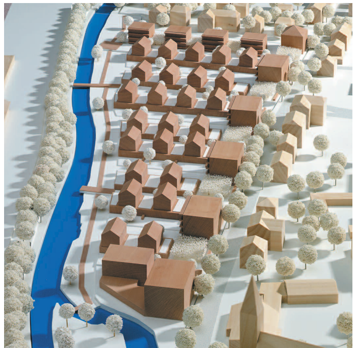
2. Preis: EPA Planungsgruppe Volker M. Mayer GmbH, Stuttgart