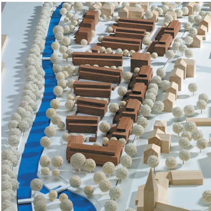
1. Preis: Hestermann · König · Schmidt + Partner, Aachen

Projektgruppe Stadt Land Fluss, Vedder Architekten – Ina Bimberg, Menden Investor: GBS Wohnungsges. mbH, Menden