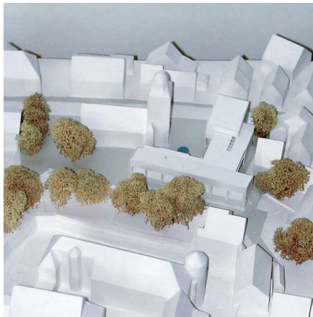
1. Preis: Meister + Wittich und Partner, Stuttgart

Eventuell könnte auf dem Wettbewerbsgrundstück auch ein neues Pfarrhaus entstehen.