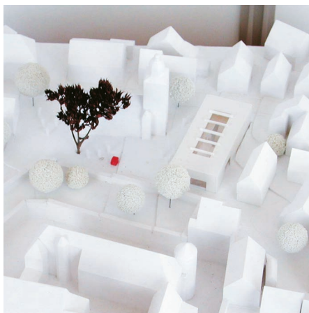
5. Preis: Jürgen Brandstetter, Göppingen