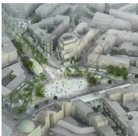
Steintor bei Nacht