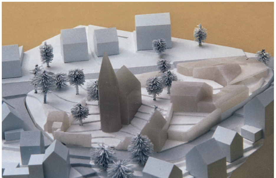
2. Preis: Penkhues Architekten, Kassel · T. Mann, Kassel