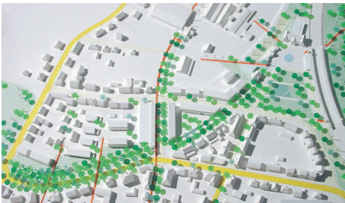
Ankauf: Lutz + Partner, Stuttgart