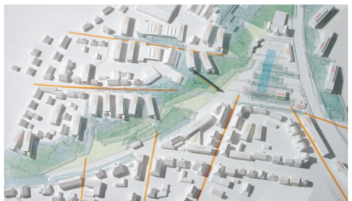
Ankauf: Däfler + Heni, Stuttgart · Gesswein und Henkel, Ostfildern