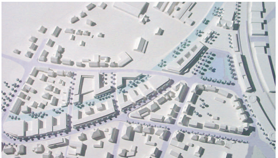
5. Preis: Roland Wallischek, Friedrichshafen