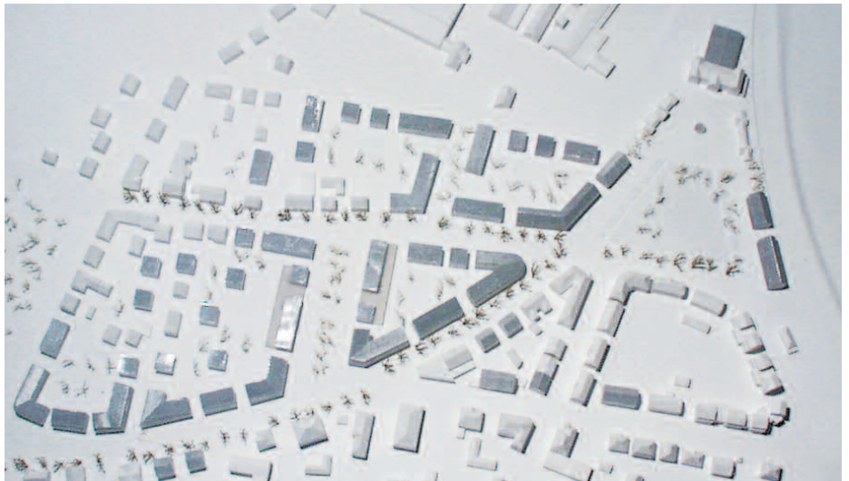
4. Preis: Numrich + Albrecht, Berlin · Thomaneck + Duquesnoy, Berlin