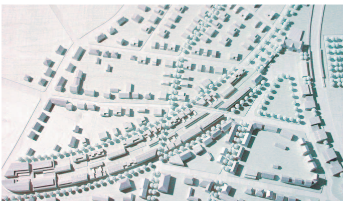
Ankauf: Lunetto + Fischer, Berlin · Stadt Land Fluss, Berlin