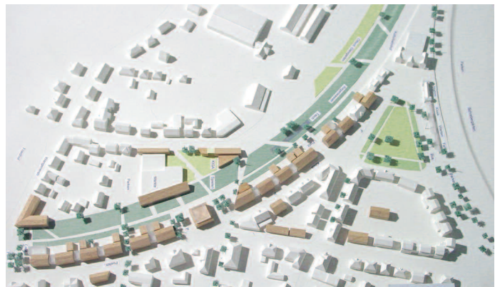
Ankauf: GMS Architekten, Isny · Senner, Überlingen