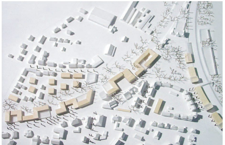
1. Preis: Krisch + Partner, Tübingen

L.Arch.: Gesswein und Henkel, Ostfildern