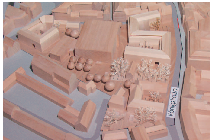
4. Preis: pier 7 Architekten, Düsseldorf