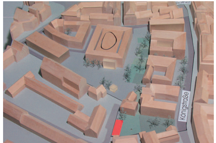
2. Preis: Chestnutt-Nies, Berlin