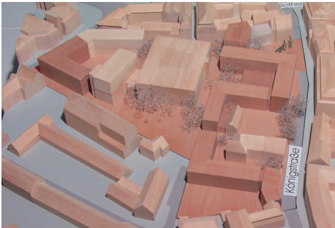
1. Preis: Maas & Partner, Münster