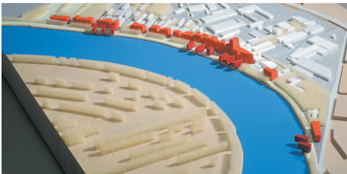
Realisierungsempfehlung: RKW, Düsseldorf