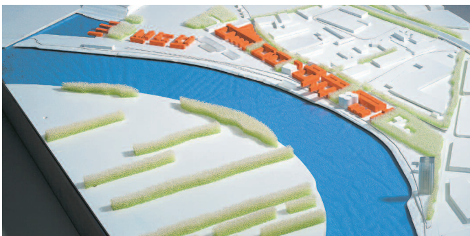
Weitere Teilnehmer: OX2architekten, Aachen